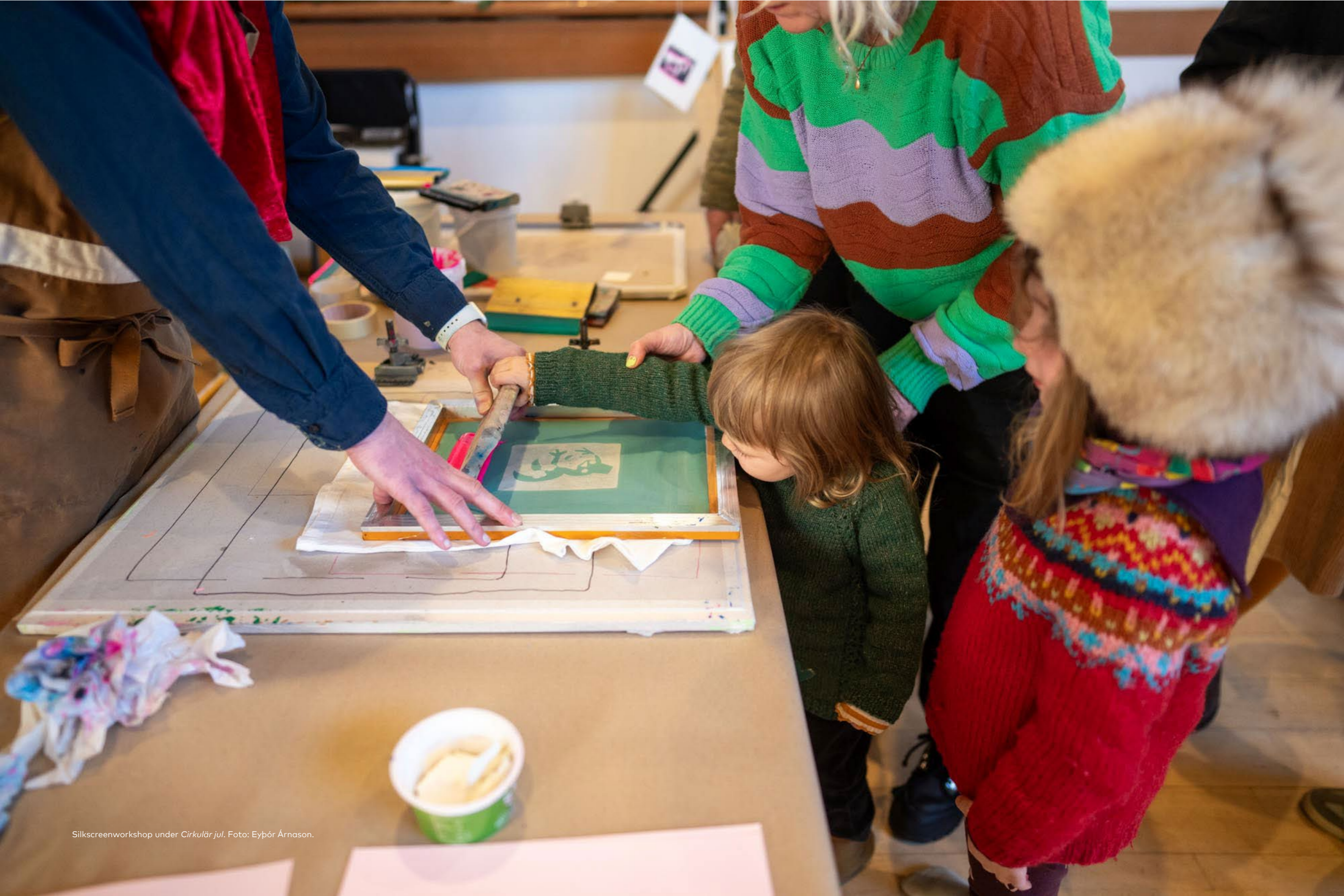
Silkscreenworkshop under Cirkulär jul .