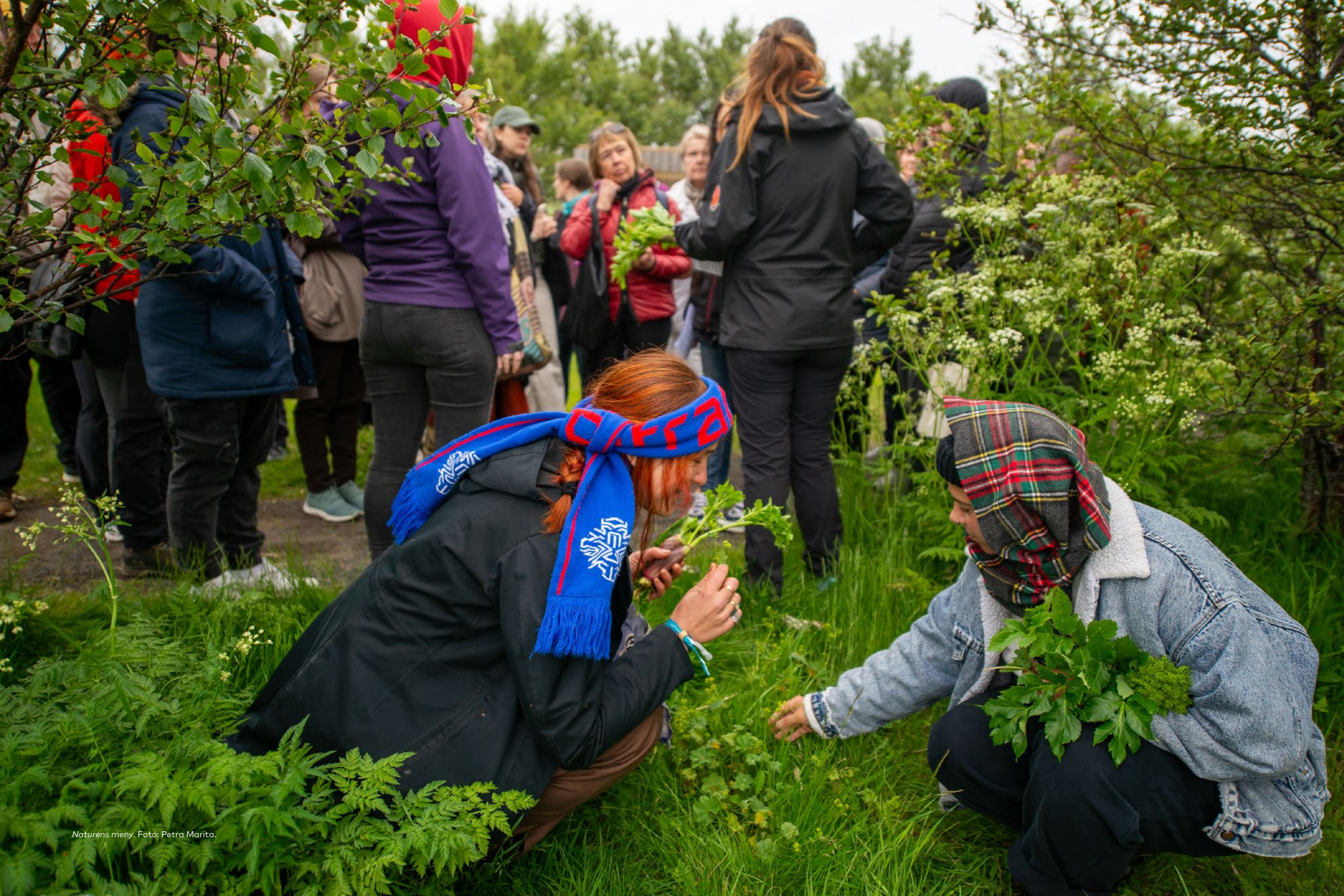
Naturens meny.