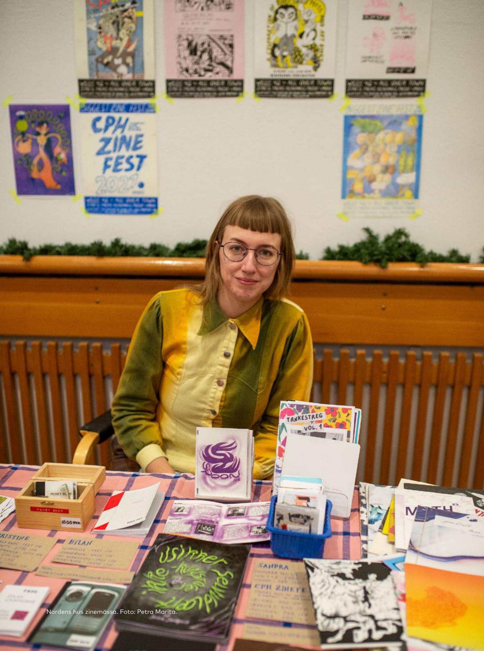
Nordens hus zinemässa.