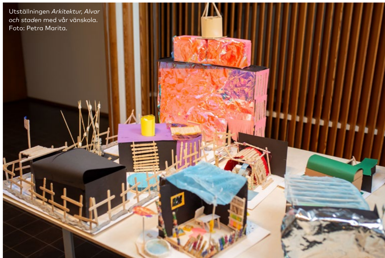
Utställningen Arkitektur, Alvar och staden med vår vänskola.

Under sommaren deltog Nordens hus och Norden i Fokus i det pedagogiska projektet Se, så och smaka i samarbete med NordGen och Botaniska trädgården i Reykjavik. Frön och undervisningsmaterial utvecklat av NordGen distribuerades till skolklasser i Reykjavik. Totalt 878 isländska barn deltog i projektet under våren 2024, och odlade växterna i sina skolor. Målet med projektet var att lära barn och unga varifrån den odlade maten kommer och hur viktigt det är med genetiska resurser och biologisk mångfald. Liksom tidigare år samarbetade vi med organisationen W.O.M.E.N. in Iceland kring odling av växter utanför Nordens hus. Denna organisation för kvinnor med utländsk bakgrund sköter odlingen av växter i växthuset och drivbänkarna utanför det. De får frön av NordGen och projektet är samtidigt ett socialt projekt som sammanför kvinnor och skapar en mötesplattform för dem i Reykjavik.