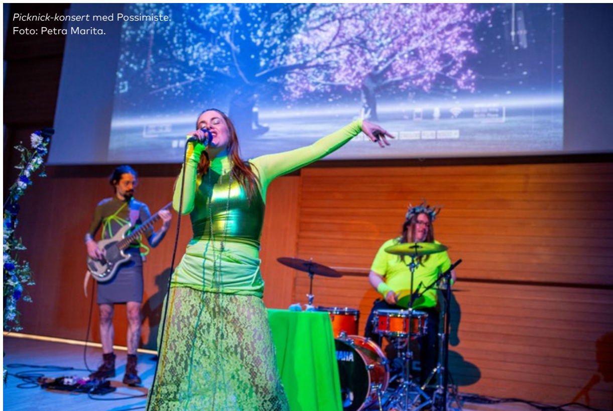
Picknick-konsert med Possimiste.

Nordens hus i Reykjavík ger information om de nordiska kulturstödprogrammen och erbjuder korta informationsmöten både digitalt och på plats i Nordens hus. Vi har upplevt en ökning av förfrågningar om hjälp och vägledning under det senaste året och höll totalt 14 möten med 20 personer samt gav stöd också via e-post och telefon. Vi samarbetar med Nordisk kulturkontakt och bistår med kommunikation och annonsering då de håller informationsmöten på Island. Under sessionsveckan i oktober hade vi en lyckad presentation av Demos stödprogrammet. 60 personer deltog i mötet och flera personer bokade separata möten med Nordisk kulturkontakts rådgivare.