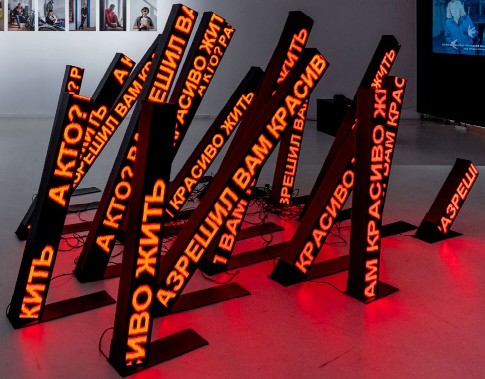
How Did I Get to the Bombshelter i Klaipeda.