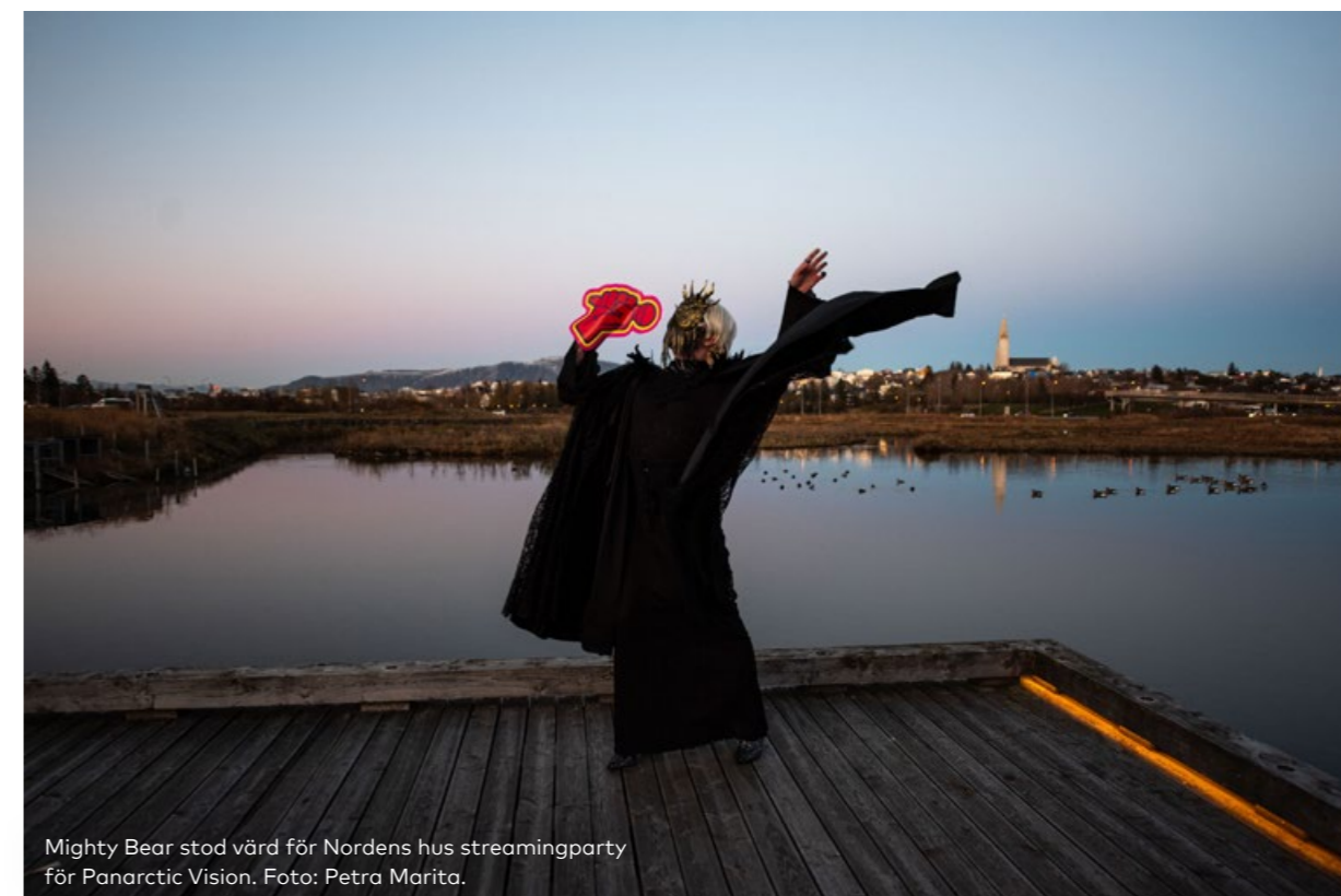
Mighty Bear stod värd för Nordens hus streamingparty för Panarctic Vision.

Vid planering av allt program är vi medvetna om att integrera jämställdhetsperspektiv och representation. Vad gäller exempelvis vårt konsertprogram har vi undertecknat The Keychange Pledge som innebär att vi lovar att ha mer än 50% kvinnor och sexuella minoriteter representerade.