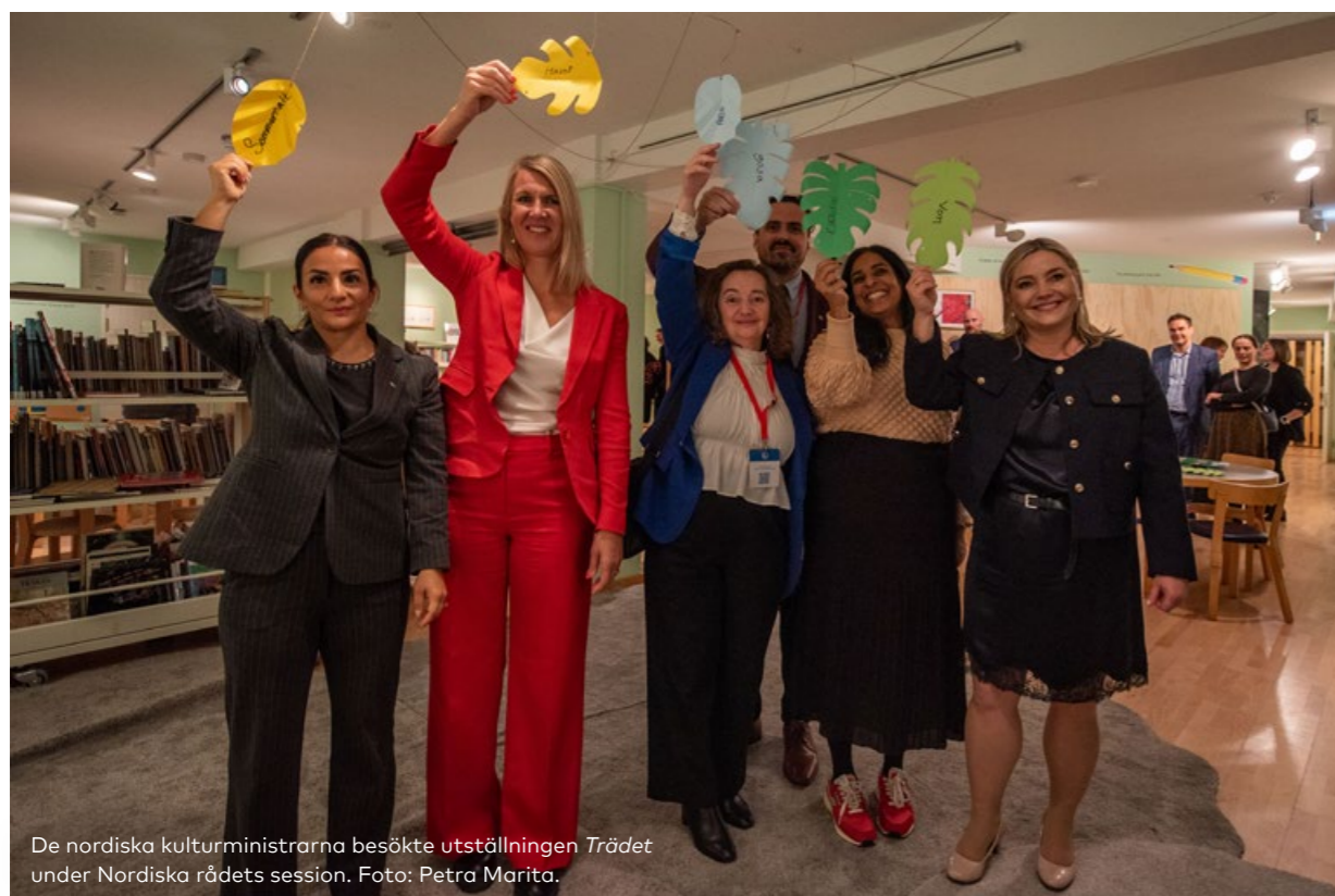
De nordiska kulturministrarna besökte utställningen Trädet under Nordiska rådets session.

Att få återinviga barnbiblioteket med en stor mångspråkig barnfest och öppning av utställningen Trädet var en positiv upplevelse efter den långa renoveringen. Utställningen Trädet utforskar trädet som koncept i nordiska barnböcker. Böckerna i utställningen ingår i materialet för projektet Den nordiska bokslukaren och har alla blivit nominerade till Nordiska rådets litteraturpris. Med var och en av böckerna följer ett pedagogiskt material på alla nordiska språk och de kan därför behandlas av pedagoger oberoende av språk. I utställningen ingår också textilsulpturen Trädet av Corinna Helenelund (FI), som är en samlade plats för läsning, och flera andra interaktiva moment. Efter att utställningen har visats i Nordens hus kommer den tack vare lokal finansiering att turnera till andra bibliotek på Island.