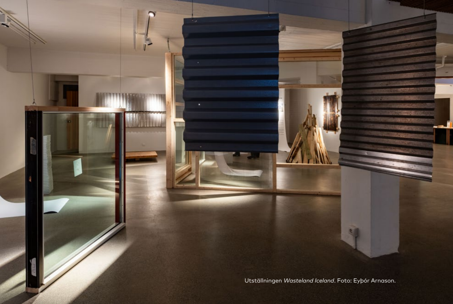
Utställningen Wasteland Iceland .