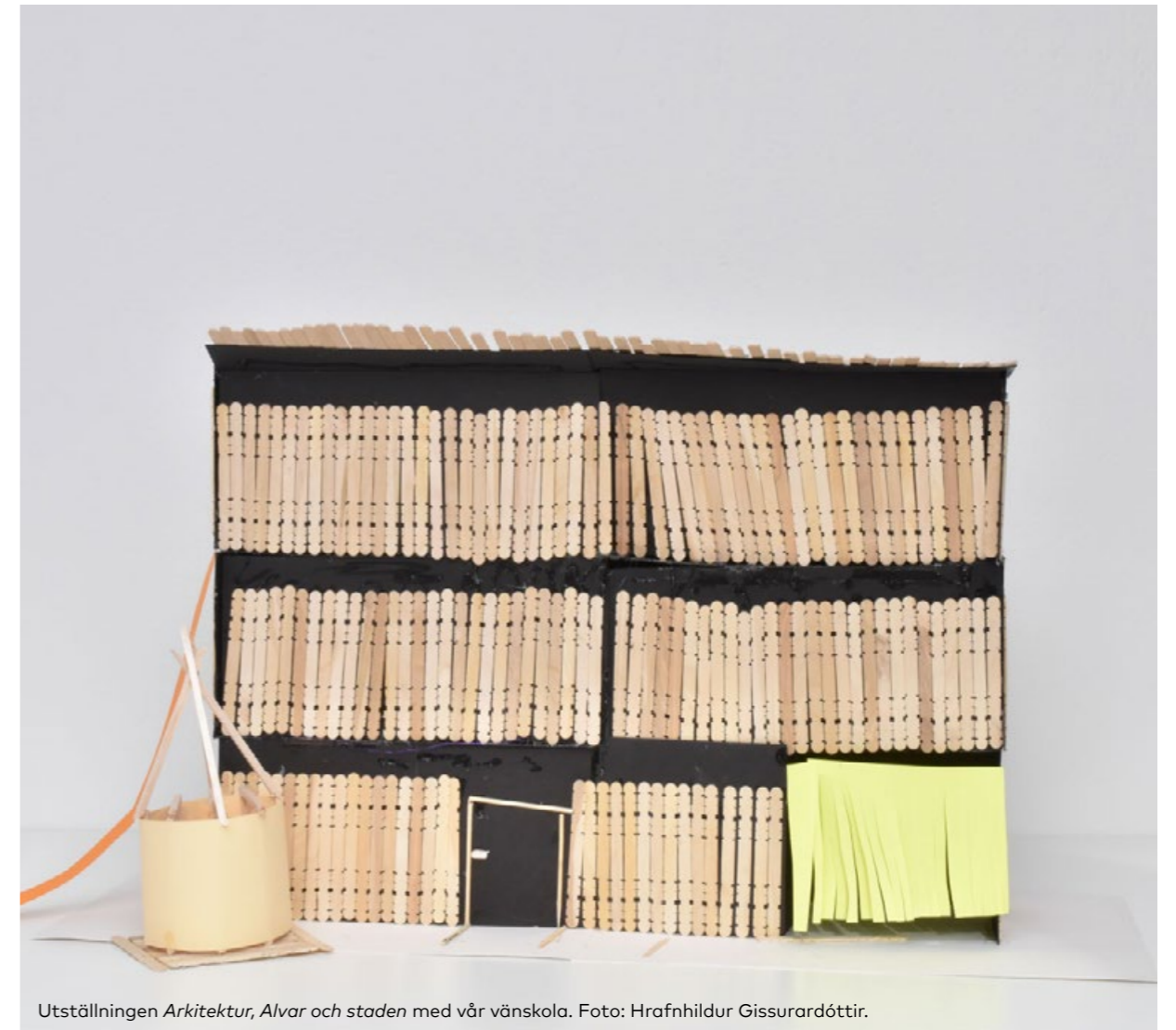
Utställningen Arkitektur, Alvar och staden med vår vänskola.