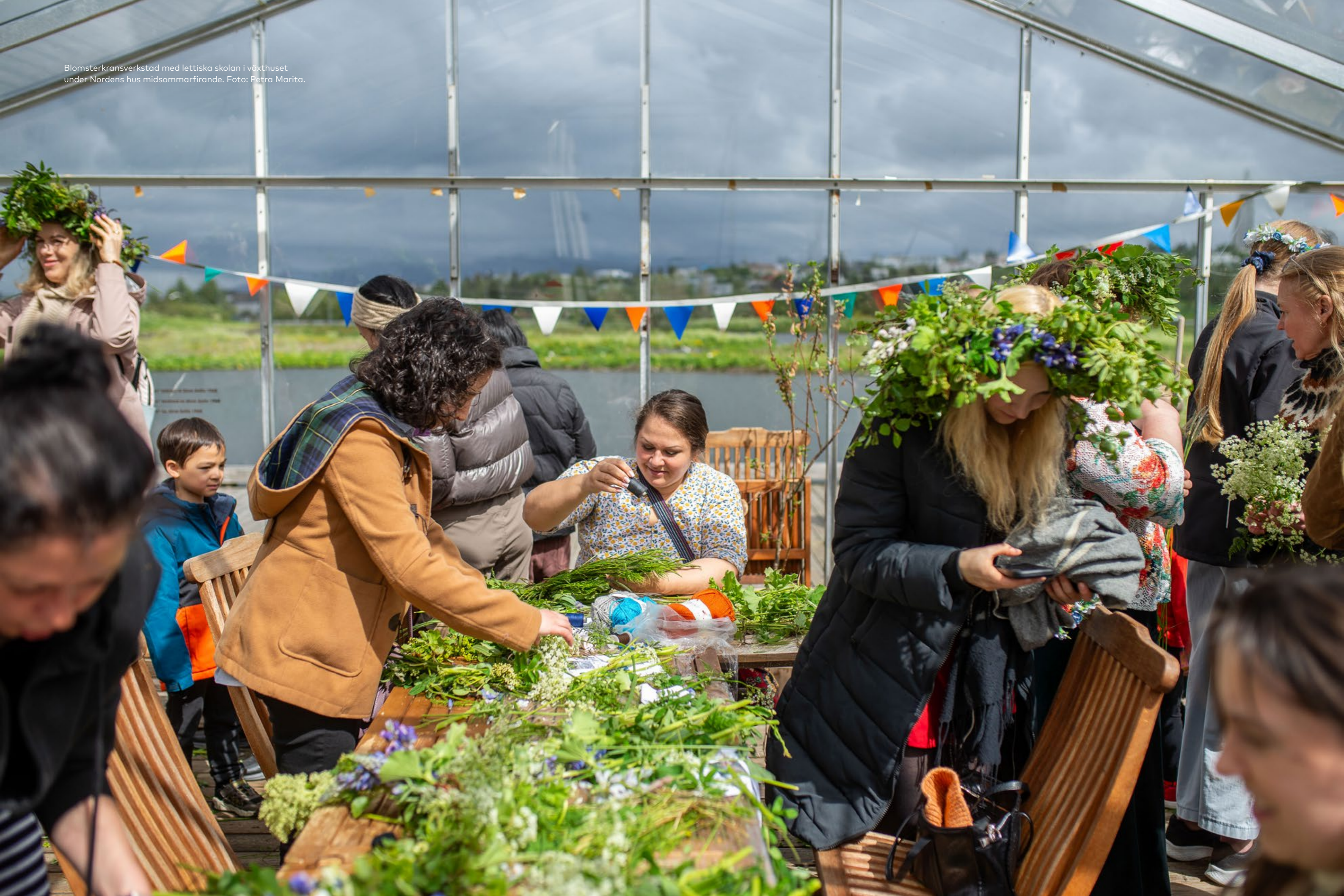
Blomsterkransverkstad med lettiska skolan i växthuset under Nordens hus midsommarfirande.